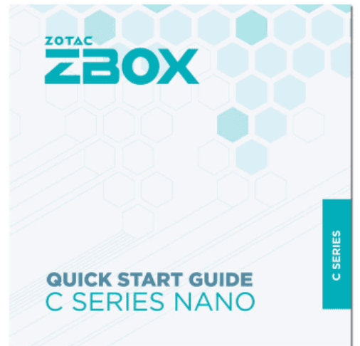
QUICK START GUIDE